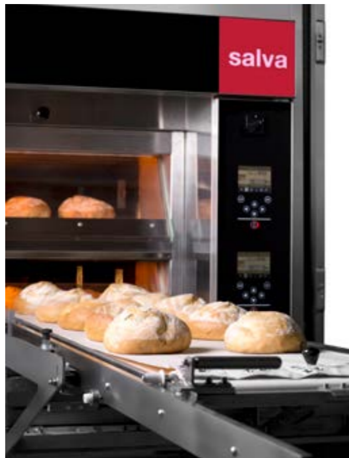
Photo Four ELECSOL de Salva.