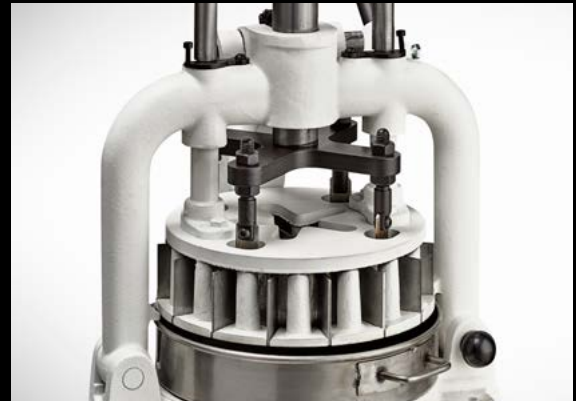
Painted cast metal body Lackierter Gusskörper

The manual lever divider is a simple machine with a cast metal body, designed to divide the dough into equal weights.