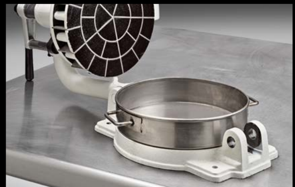
Removable stainless steel pan Herausnehmbare Edelstahlwanne