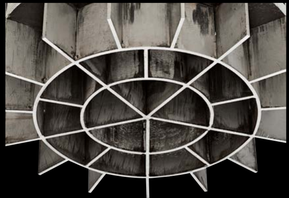
Stainless steel blades Edelstahlmesser

Es handelt sich um eine robuste, vielseitige und wartungsarme Maschine. Ihre Verwendung erleichtert die Arbeit in der Backstube, da sie den Teig immer in gleich große Stücke teilt..